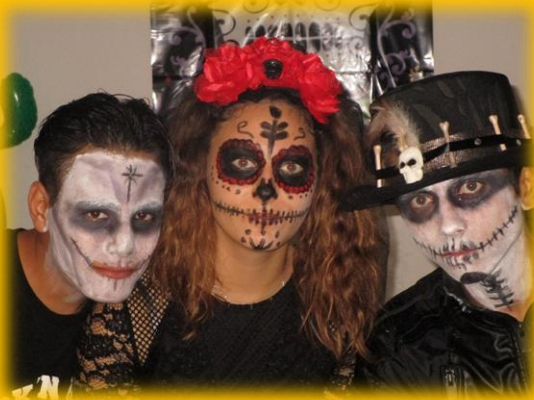
La Santa Muerte