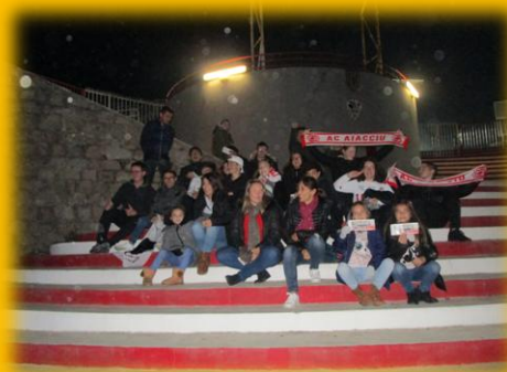
Match de l'ACA