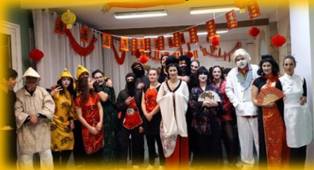
Nouvel An Chinois