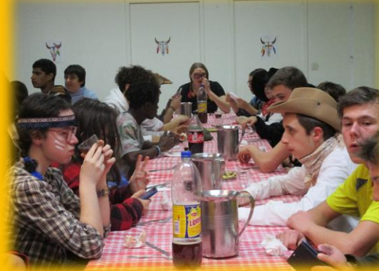
Soirée CowBoy Indien